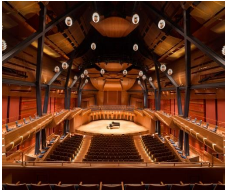
4. PPA_TaylorCentre1974 Panorama.jpg

Pfeiffer Partners Architekten wählten in der Bella Concert Hall das HAVER Architekturgewebe ECLA-LARGO 4338 zur Verkleidung der oberen Wand- und der Deckenflächen.